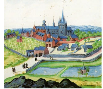
Abbaye de Floreffe Gravure ancienne