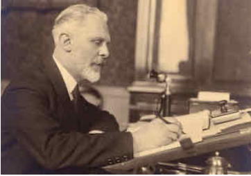
Le compositeur à son pupitre de travail

Mais le voyage continue. De la germanité, Jongen passe au monde latin. Le voici à Paris. Dans la Ville Lumière, il évolue dans l'univers franckiste, rencontre Vierne 7 et Bordes, bénéficie des conseils de d'Indy. Il fréquente Fauré, Debussy, Ravel. Se lie d'amitié avec Florent Schmitt. Enfin, voulant sans doute justifier le titre du Prix qu'il a remporté, comment ne pas se rendre à la Ville Éternelle ? Mais tout a une fin. Le Conservatoire royal de Liège réclame son talentueux élève à qui une classe