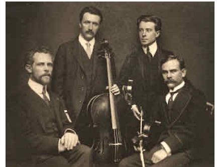
Le Belgian Quartet (Jongen est assis à gauche)